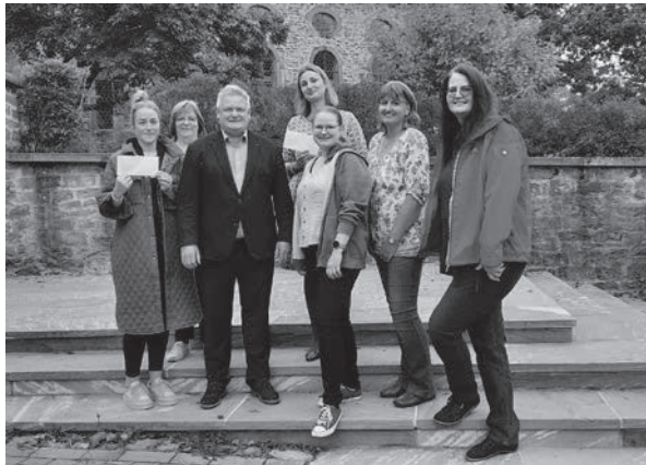
Über das Spendenergebnis von 1.860 Euro freuen sich die Vertreterinnen der drei Eschauer Kindertagesstätten