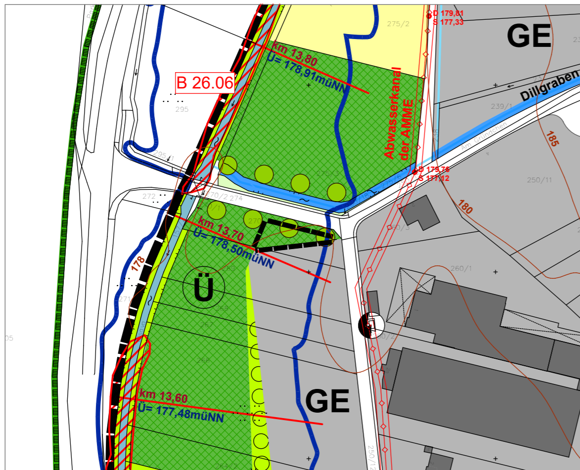
Ausschnitt aus der aktuellen Fassung des FNP des Marktes Eschau mit Kennzeichnung des Änderungsbereichs