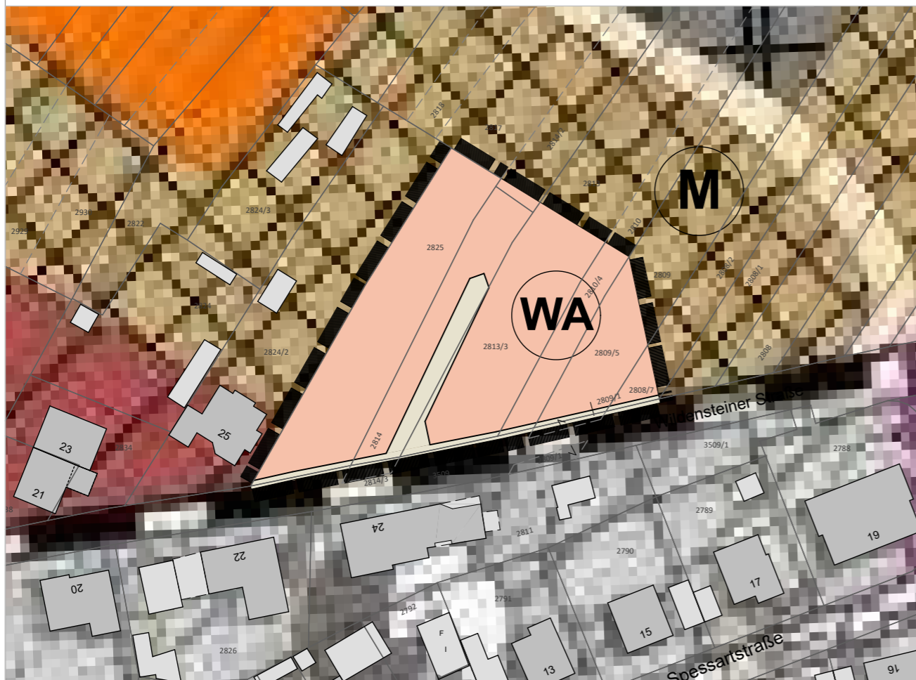
Berichtigte Fassung des FNP (Ausschnitt)