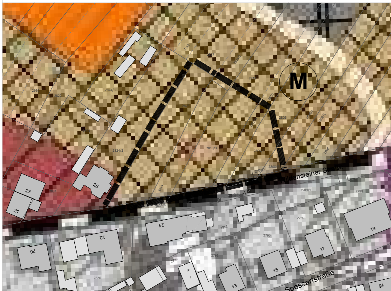
Ausschnitt aus der aktuellen Fassung des FNP des Marktes Eschau (Änderung Bereich Bebauungsplan "Quelle") mit Kennzeichnung des Geltungsbereichs