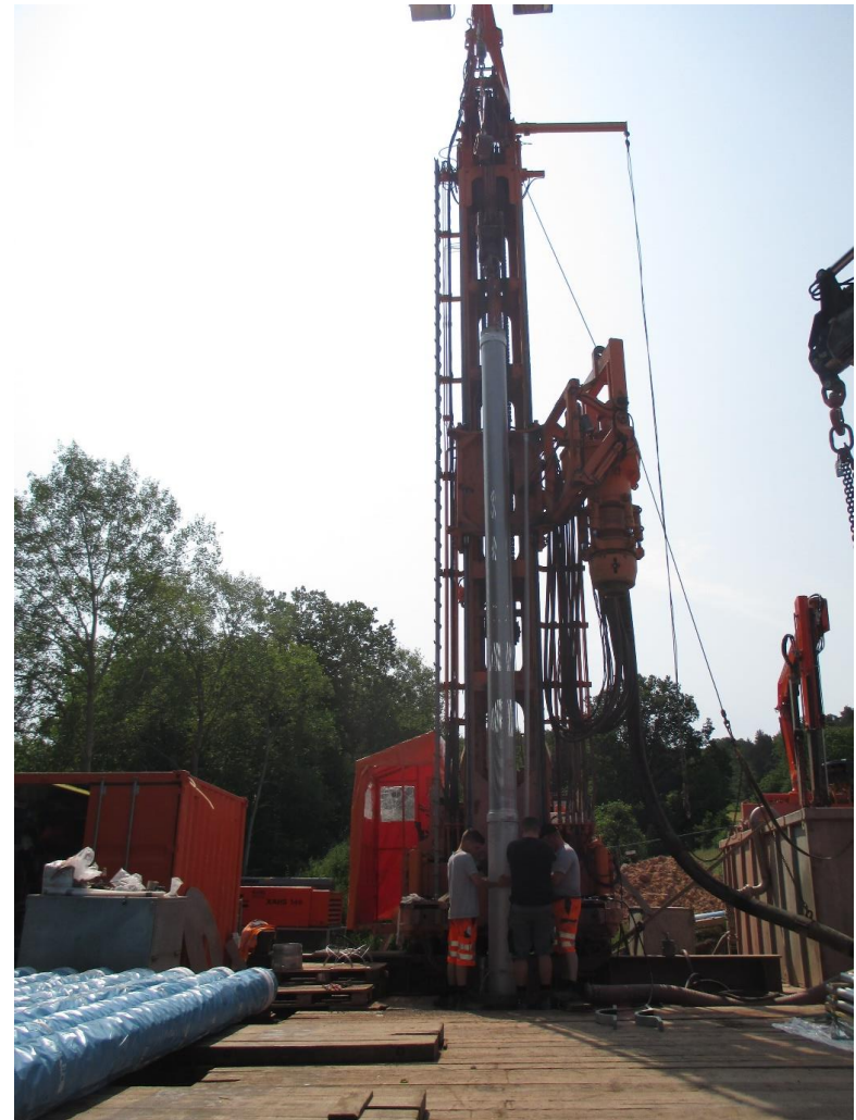
Einbringen der Voll- und Filterrohre aus Edelstahl - DN 300